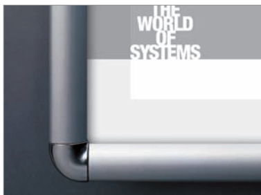
Hochglanz verchromte Ecken