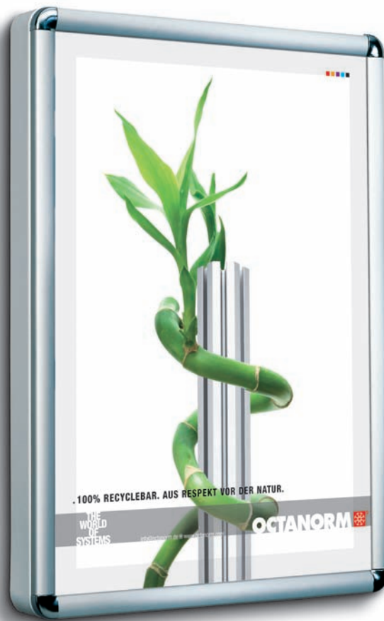
Modellbeispiel: T-L 1, Panelempfehlung: Papier-Plakat, Format A1

Werbebotschaften ins rechte Licht rücken. Plakate im Format DIN A1 bekommen damit endlich die Aufmerksamkeit, die sie verdienen. Der Leuchtkasten mit Polystyrol-Gehäuse und Aluminium-Klapprahmen ist ausschließlich für den Einsatz im Innenbereich konzipiert. Er wird einfach an die Wand gedübelt und über ein 2 m Kabel mit Schalter beleuchtet. Der Klapp-Wechselrahmen ermöglicht eine rasche Aktualisierung der Werbebotschaften, die hinter der klaren Schutzfolie aufmerksamkeitsstark präsentiert werden.