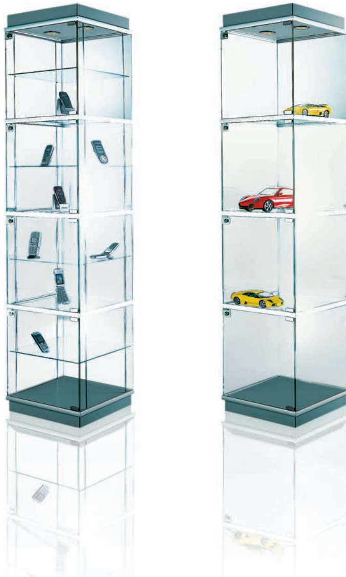
Modellbeispiele: PV-80 und PV-40

Ware braucht Inszenierung. Produkte erscheinen attraktiver, wenn sie ins richtige Licht gerückt werden. Die Präsentationsvitrine von OCTANORM ist so konstruiert, dass sie aus dem Stand die Kunst der Verführung beherrscht. Aufmerksamkeit erregt, ohne sich selbst in den Vordergrund zu rücken. Die Information, die Ware, das Produkt, ist der Star.